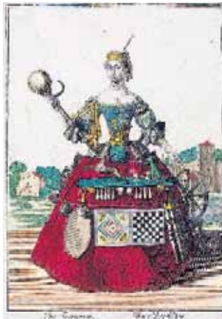
„Eine Drehschle(r)in“ mit Schach- und Mühlebrett: Kolorierter Kupferstich von Martin Engelbrecht um 1730.

Mit einer Schach-Ausstellung zwischen Barock und Biedermeier meldet sich die bayrische Stadt Grafing zu Wort. Von ruf&ehn